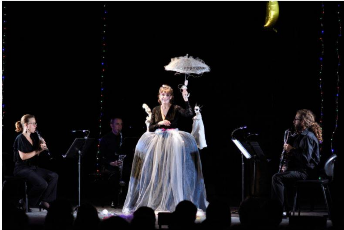
None Quartet

Il Giornale de la Musica, presse spécialisée italienne à l'occasion du festival d'Ambronay 2021