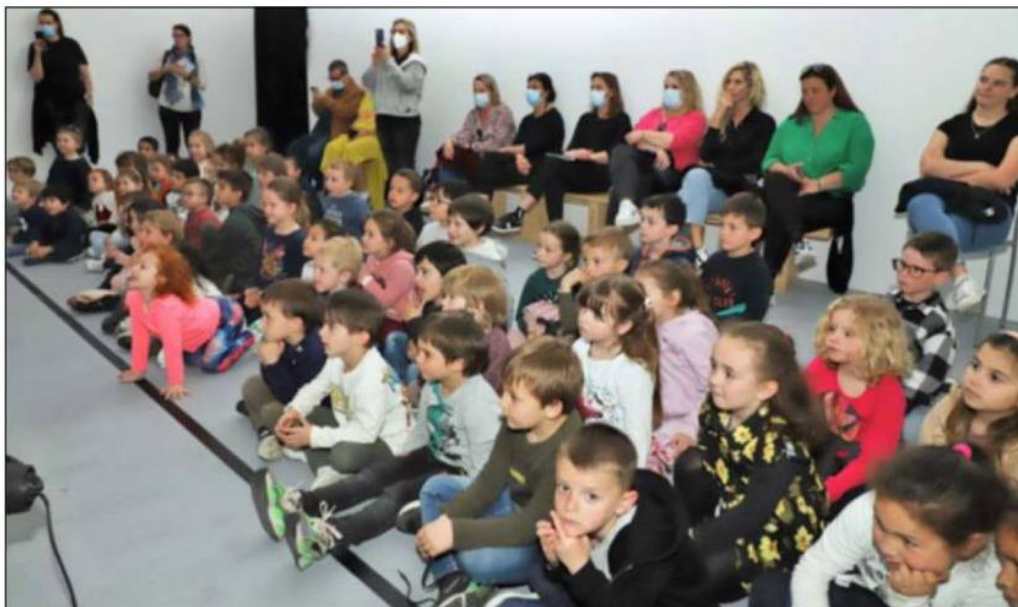
Mardi, au musée, les maternelles de Sandreschi étaient les premiers à découvrir le spectacle.

Prochain rendez-vous du Musée de la Corse, le 14 mai à 21 heures : Lucilla Galeazzi se produira en trio, dans le cadre de la Nuit des Musées.