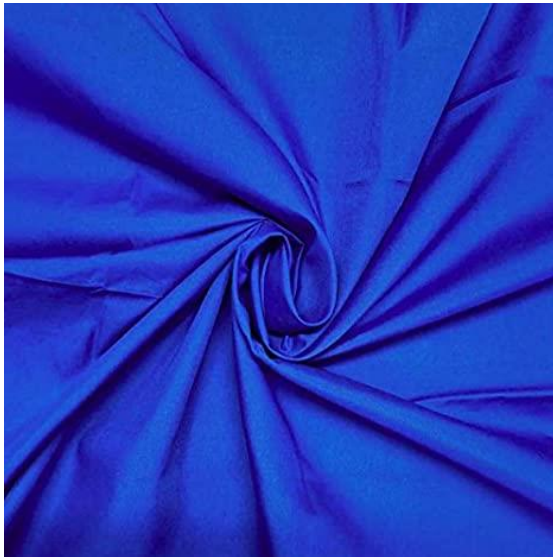
couleurs pour Isabelle