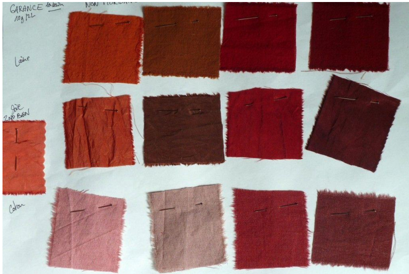
couleurs pour Benjamin